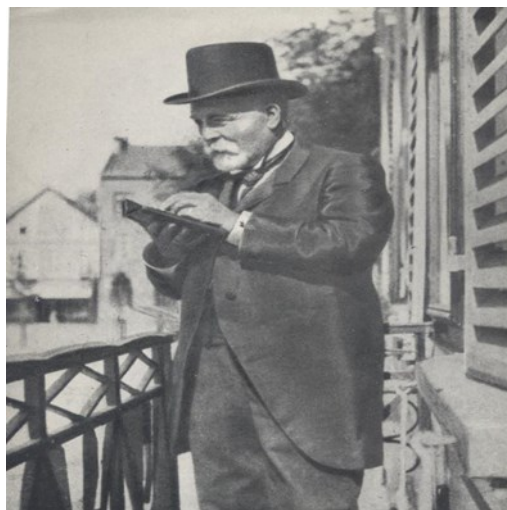
Slika 5 Joseph Oller

Čovjek koji je prvi osmislio sustav koji je donekle garantirao sigurnu zaradu i priređivaču oklade i onima koji bi eventualno pogodili koji konj će osvojiti utrku bio je Joseph Oller. Zaključio je da takav sistem zahtjeva dosta računanja, te je morao osmisliti poseban mehanički uređaj za takvo što. Kako je to klađenje zapravo funkcioniralo? Osoba koja ulaže novac odabere konja za kojeg misli da će pobijediti i na njega polaže određeni iznos. Kako nisu postojali fiksni tečajevi, dobitak se računao tek nakon svih uplata. Priređivač igre (engl. Bookmaker ) ostvarivao je otprilike dobit koja je iznosila 5% od svih uplata, a ona je naravno mogla biti i veća zbog prirode sportskog klađenja. Ukoliko bi pobijedio konj koji je važio za totalnog autsajdera, dobit priređivača mogla je biti i daleko veća.