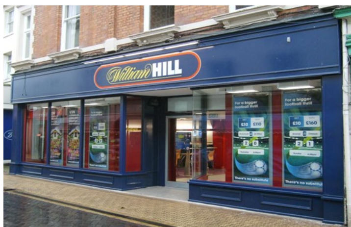
Slika 6 Kladionica William Hill

U 20. je stoljeću igračima napokon ponuđeno klađenje na sportove koji nisu konjičke utrke ili boks. Uključeni su sportovi poput nogometa, košarke ili tenisa, ali se moglo isključivo kladiti hoće li netko pobijediti ili izgubiti. Prve oklade na nogomet postavljene su 1921. godine, a zahvaljujući Britancu Williamu Hillu koji je osnovao jednu od prvih kladionica, broj aktivnih igrača do sredine 20. stoljeća bio je oko 500.000. Danas William Hill slovi za jednu od najpoznatijih kladionica na svijetu.