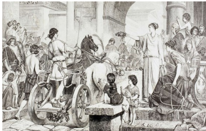
Slika 3 Olimpijada u antičko doba

Počeci sportskog klađenja datiraju još iz davne prošlosti. Stari Grci su i danas poznati po svojoj sklonosti sportskim aktivnostima, a nisu bez razloga mnogi od njih prikazani u obliku sportskih kipova. Prve sportske oklade su navodno postojale još 676. godina pr.Kr. kada se održavala jedna od Olimpijada.