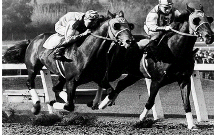
Slika 4 Konjičke utrke u 18.stoljeću