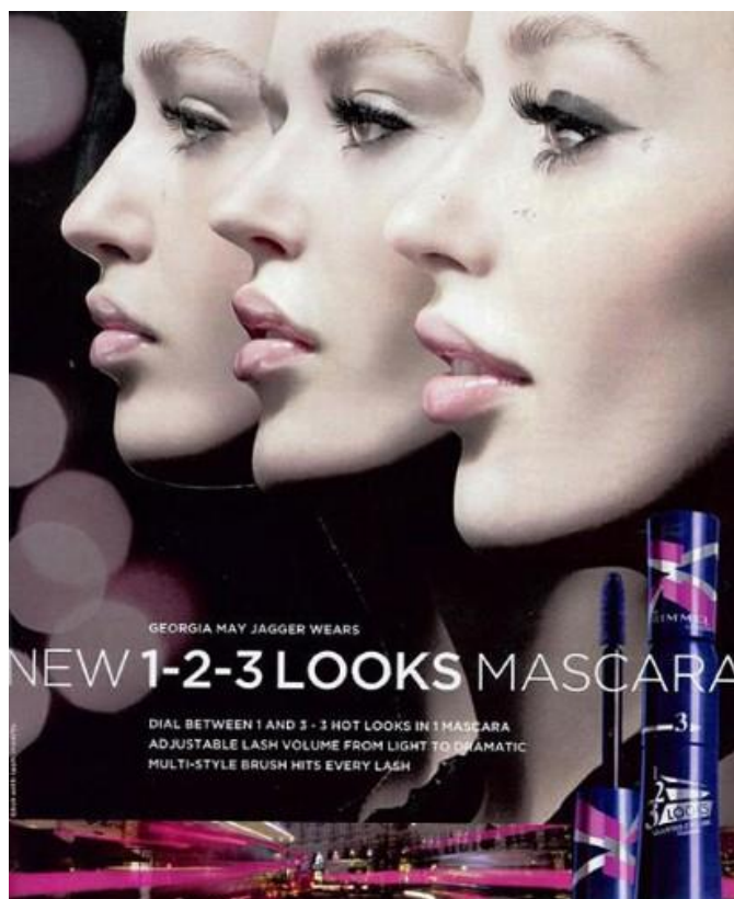
Slika 4.1 primjer zavaravajućeg oglašavanja za maskaru