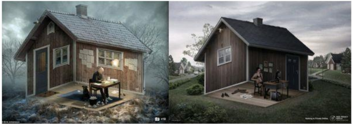
Slika 4.14 - primjer oponašanja tuđeg djela ( izvor:

vlasništva. Pod intelektualnim vlasništvom postoje dvije podgrupe prava, a to su autorsko pravo i industrijsko vlasništvo. Autorsko pravo podrazumijeva isključivo pravo autora na korištenje svojih tvorevina. 15 U industrijsko vlasništvo spadaju zaštitni znak ili žig, patenti, industrijski dizajn, oznaka zemljopisnog porijekla i izvornosti. Do povreda intelektualnog vlasništva dolazi kopiranjem ili plagiranjem te oponašanjem nečijeg djela, poput oponašanja komunikacije konkurencije, proizvodnja sličnih ambalaža i drugo.