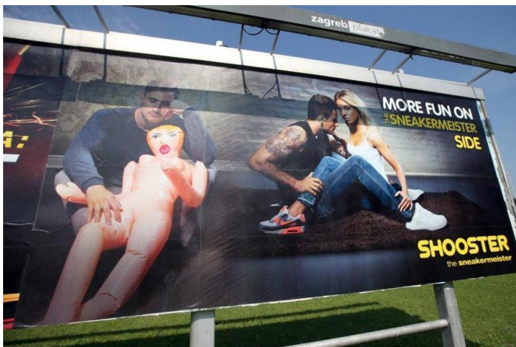
Slika 4.11 – primjer oglasa kompanije Shooster koji narušava načelo pristojnosti

Na slici 4.11 nalazi se primjer oglasa kompanije Shooster koji se pojavio na jumbo plakatima u Republici Hrvatskoj. Oglas narušava načelo pristojnosti, a time i drugi članak Kodeksa oglašavanja i tržišnog komuniciranja. Prema tom članku tržišna komunikacija ne bi smjela narušavati standarde pristojnosti u nekoj državi i kulturi.