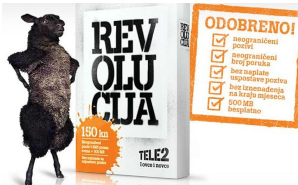
Slika 4.3 - primjer zavaravajućeg oglasa kompanije Tele 2 ( izvor: https://www.24sata.hr/media/img/ca/0d/e4fda78af250290533e7.jpeg )

Na slici 4.3 nalazi se primjer zavaravajućeg oglašavanja u Republici Hrvatskoj. Kompanija Tele 2 u svom oglasu tvrdi kako u tarifi Revolucija postoje neograničeni pozivi i poruke te kako nema iznenađenja na kraju mjeseca. Nažalost, kompanija je odmah u ugovoru ograničila količinu poziva i poruka, pa se u oglasnoj poruci zapravo iznose neistine te se potrošači na taj način zavaravaju.