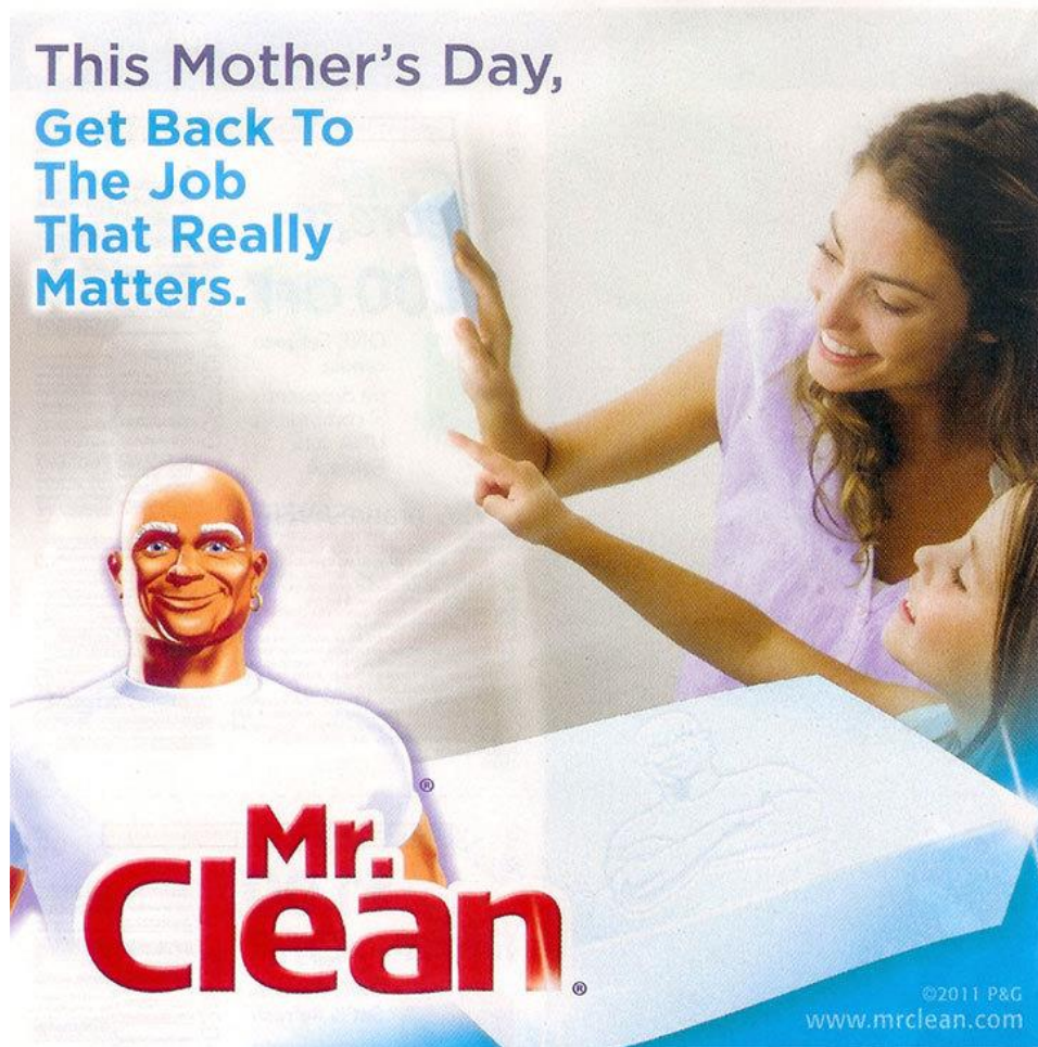
Slika 4.12 - primjer stereotipa u oglasu za Mr.Clean (izvor:

Kraljevstvu odlučila je stati na kraj seksističkim stereotipima u oglasima pa će se od lipnja 2019. godine zabraniti korištenje takvih stereotipa u oglasima u Ujedinjenom Kraljevstvu. 13