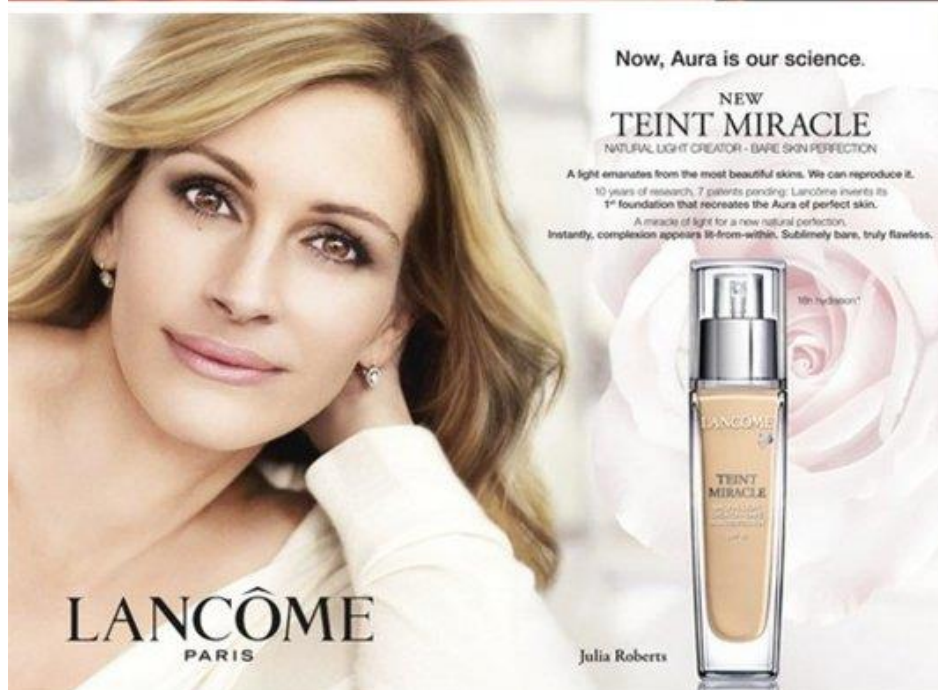
Slika 4.2 - primjer zavaravajućeg oglašavanja za kreme

Na slici 4.2 nalaze se dva primjera zavaravajućeg oglašavanja, koje je također ASA u Velikoj Britaniji zabranila. Oglasi su zabranjeni jer su modeli na fotografijama pretjerano izglađeni putem programa za uređivanje fotografija. Takvim pristupom prenaplašava se učinkovitost proizvoda.