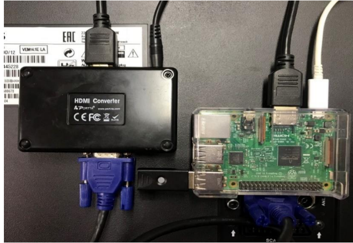
Slika 3.2. Spajanje uređaja