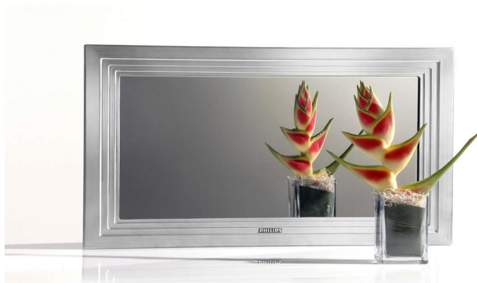
Slika 2.5. Philips Mirror TV 8