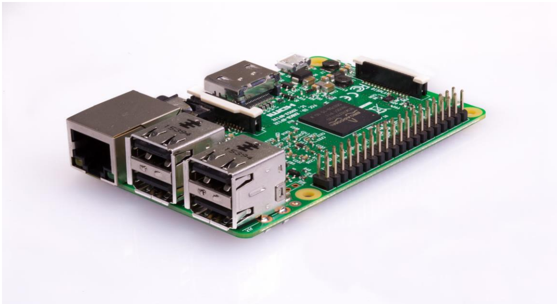
Slika 2.1. Raspberry Pi 3 1

Video jedinica može proizvesti standardne televizijske rezolucije: HD, Full HD, NTSC, PAL i CRT TV. Bez mijenjanja postavki, u izvornom stanju podržava ove rezolucije: 640×350 EGA; 640×480 VGA; 800×600 SVGA; 1024×768 XGA; 1280×720 720p HDTV; 1280×768 WXGA; 1280×800 WXGA; 1280×1024 SXGA; 1366×768 WXGA; 1400×1050 SXGA+; 1600×1200 UXGA; 1680×1050 WXGA+; 1920×1080 1080p HDTV; 1920×1200 WUXGA. Grafička jedinica u RP3 radi na višim frekvencijama do 300 MHz ili 400 MHz, dok njegovi prethodnici rade na 250 MHz, što RP3 omogućuju bolju i bržu obradu slika ili videa pri većim rezolucijama ( https://www.raspberrypi.org/documentation/configuration/config-txt/video.md ).