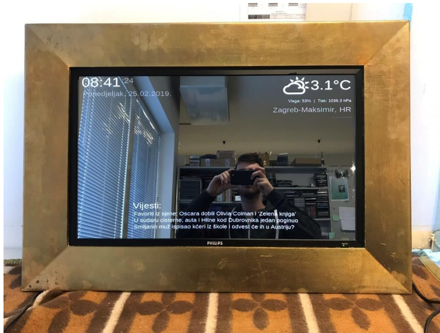
Slika 3.1. Finalni izgled aplikacije