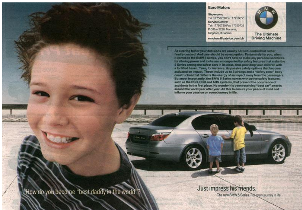
Slika 4.6 – Primjer neetiĉnog korištenja djece u oglasu marke BMW

Na slici 4.6 nalazi se primjer neetiĉkog korištenja ranjive skupine u oglasu. U oglasu za BMW automobil se prikazuje dijete u prvom planu. Pitanje koje se postavlja u oglasu je: „Na koji se naĉin postaje najbolji tata na svijetu?“, a kao odgovor naveden je sljedeći: „Samo trebate oduševiti njihove prijatelje.“. U ovom se oglasu iskorištava roditeljska ljubav prema djetetu jer će oni napraviti sve kako bi njihovo dijete bilo sretno. U pozadini se vide i prijatelji djeteta kako su oduševljeni automobilom koji vozi tata djeteta. Dijete u prvom planu vrlo je sretno i ponosno, a stav tijela njegovih prijatelja sugerira da bi i oni htjeli da njihov otac vozi takav auto. Takav oglas nipošto nije etiĉan jer promiĉe i materijalizam koji je sve izraženiji u današnjem svijetu.