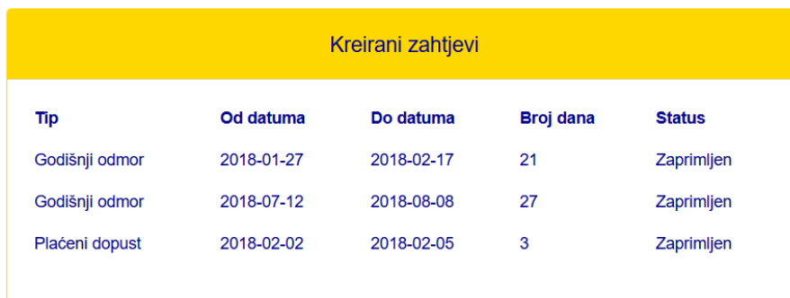
Slika 30: Popis kreiranih zahtjeva

Ako su svi uvjeti forme zadovoljeni, klikom na gumb „Kreiraj zahtjev“ novi zahtjev se kreira i prikazuje se na profilu zaposlenika, što prikazuje slika 30.