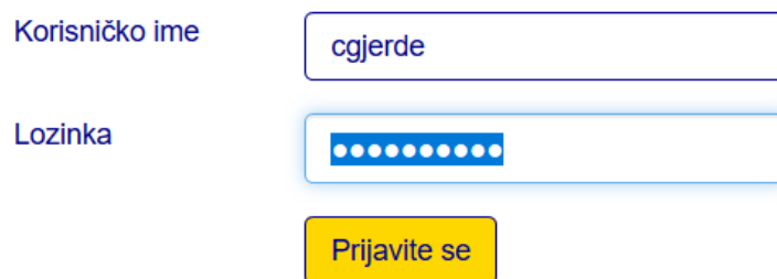
Slika 28: Prijava u aplikaciju

Aplikacija izrađena za potrebe ovog rada je aplikacija za evidenciju korištenja dana godišnjih odmora i plaćenih dopusta zaposlenika neke firme. Aplikacija se sastoji od dva osnovna dijela: modula za kreiranje zahtjeva za godišnje odmore i plaćene dopuste i rezervacije hotelske sobe u odabranom gradu. U aplikaciji je također implementirana mogućnost kreiranja Excel izvješća (samo rukovoditelji odjela imaju tu mogućnost). Aplikaciji se pristupa preko web forme za prijavu upisom korisničkog imena i lozinke, što je prikazano na sljedećoj slici.